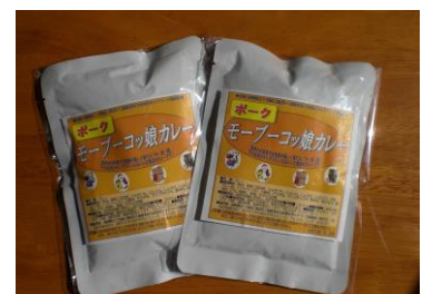
（カレーも作ってみました！）