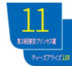
牝馬限定重賞競走のゼッケン