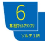
重賞競走のゼッケン